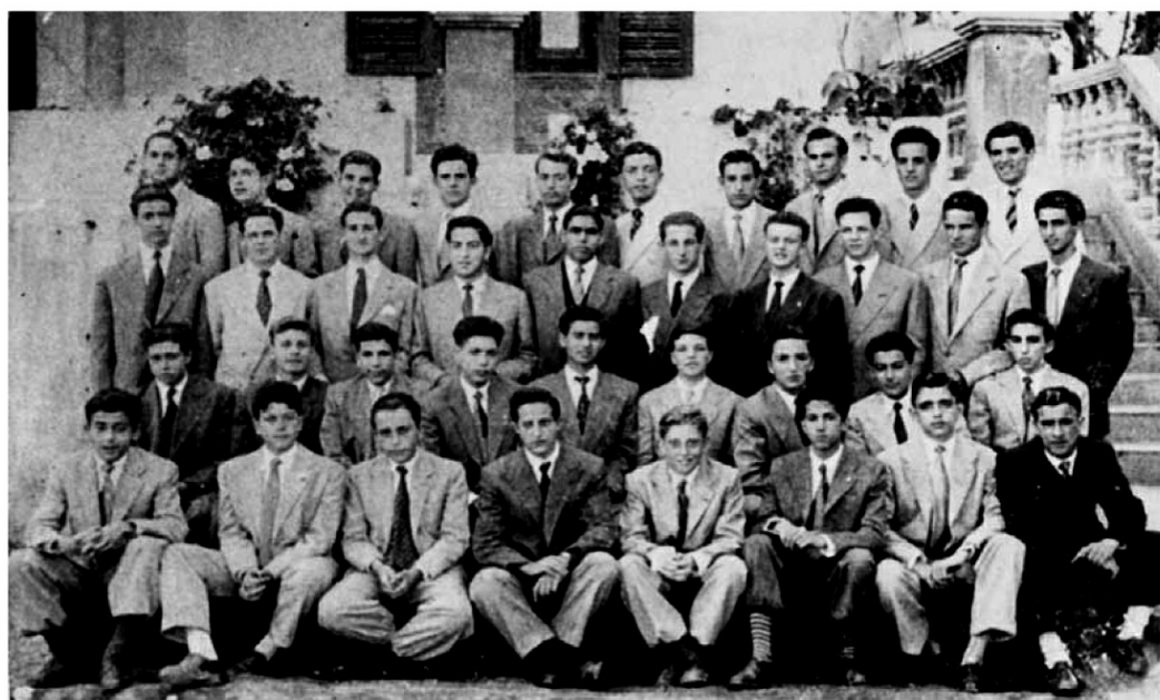
1952-53 5ª PROMOCIÓN (arriba abajo y de izq a derecha)

Comienza un nuevo sistema académico , que entre otras medidas, significó la introducción del PREU