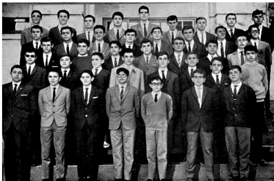
1967-68 20ª Promoción (De izquierda a derecha y de arriba abajo)

La apertura del jardín infantil supuso una revolución, siendo el primero que se creó en Tenerife